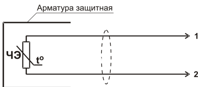
Рисунок 1 - Схема подключения

Схема подключения приведена на рисунке 1.